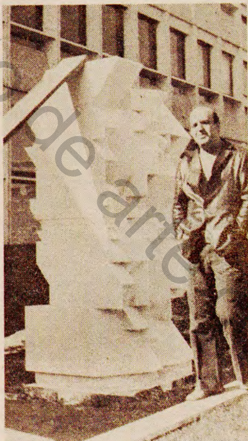
L'artiste devant son œuvre au cours du montage