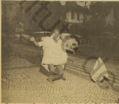
Mosquito veste um Parangolé, idealizado pelo artista plástico Helio Otília