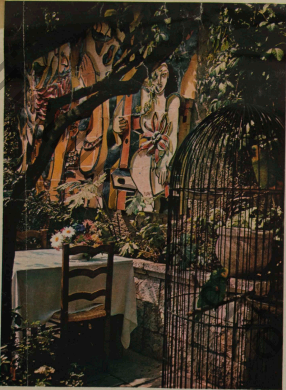
No restaurante "La Colombe D'Or", em Saint Paul de Vence, Leger fez um mural no pátio.