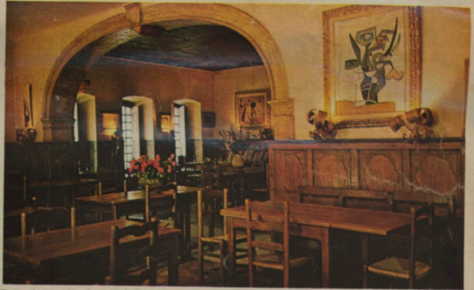
Esta é a sala de refeições do "La Colombe D'Or". Em primeiro plano, um Picasso.