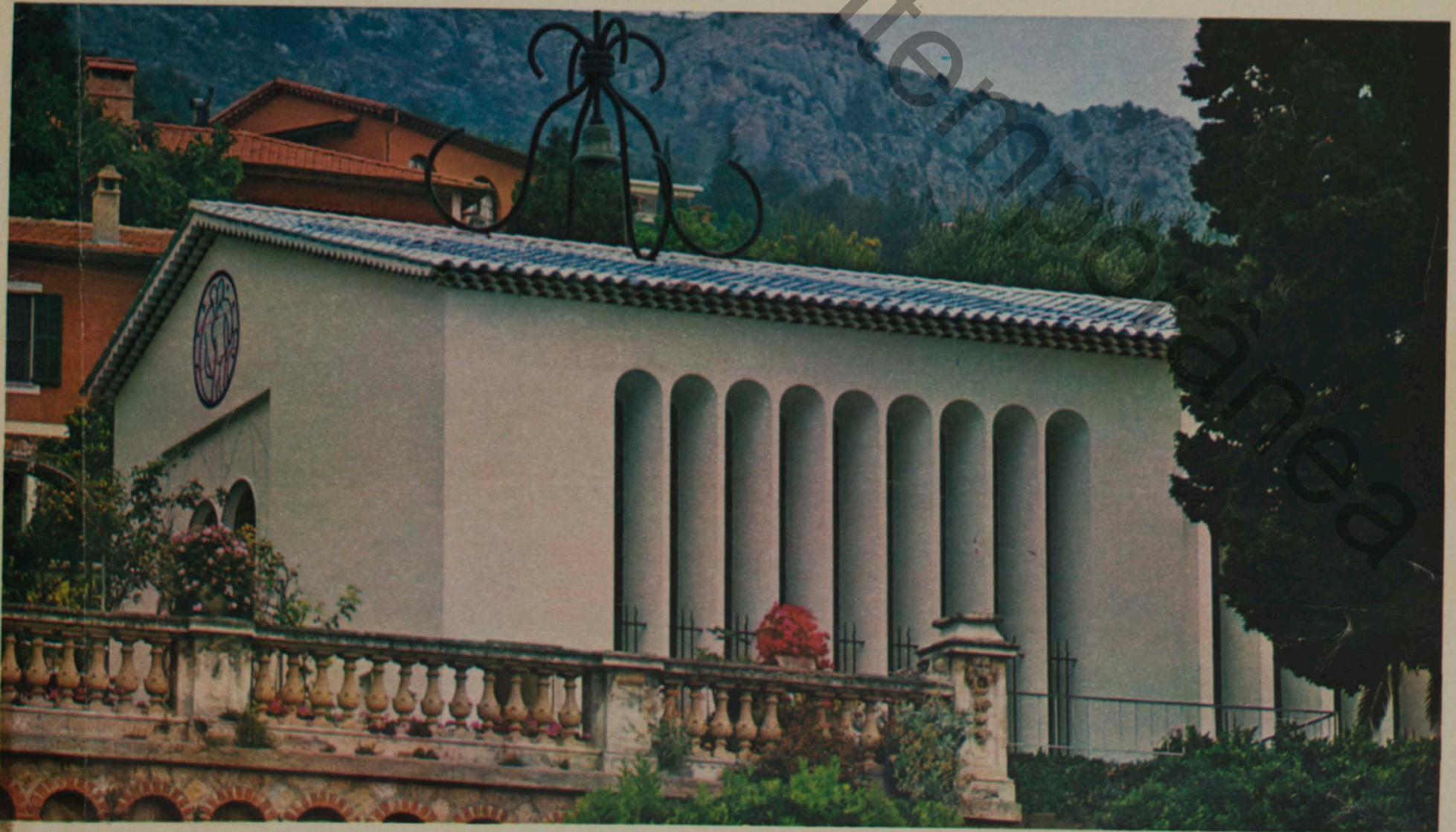
Esta é a capela de Vence, em cujo interior não se pode fotografar por ordem do próprio Matisse. Assim, êle garantiu o monopólio dos cartões postais mostrando o altar e os vitrais da capela.