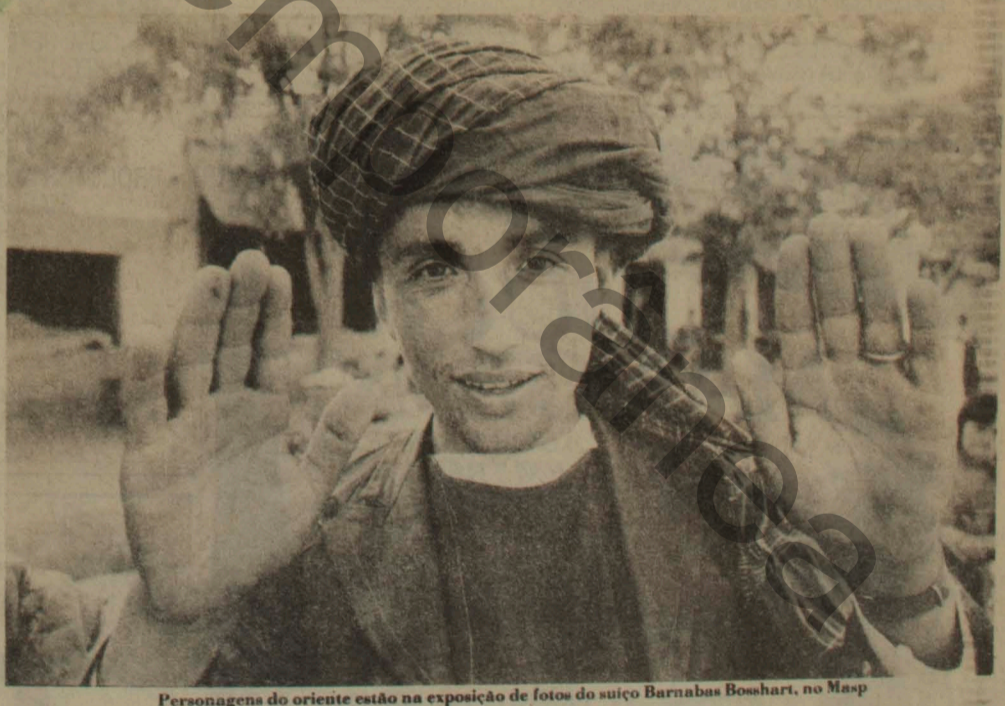
Personagens do oriente estão na exposição de fotos do suíço Barnabas Bosshart, no Masp

DREAMING SÃO PAULO - Fotografias de Fábio Maranhão - de 5 de maio a 6 de junho, na Livraria e Café Belas Artes (av. Paulista, 2448, zona central de São Paulo, tel. 256-8316).