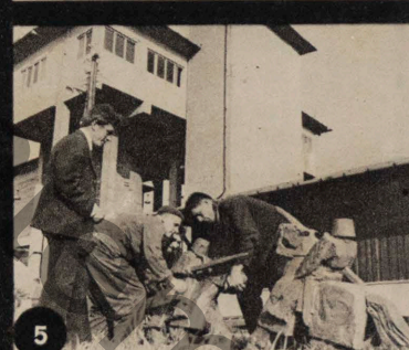
5 UNE MANIFESTATION CONCRÈTE DU MÉCENAT SOCIAL SUR LE DÉVELOPPEMENT DE L'ART : LA «REPUBLIQUE DE LA SCULPTURE» AU PAYS DU MARBRE, DU BASALTE, DU GRES, TEXTE ET PHOTOS EN PP. 14-15