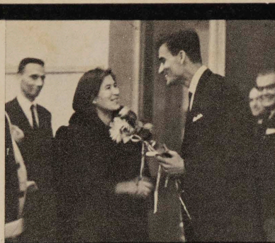
RAM MALAVIAH URBANISTE ET ARCHITECTE DE L'INDE, DOCTEUR PEU COMMUN DE L'ÉCOLE POLYTECHNIQUE DE VARSOVIE. TEXTE ET PHOTOS EN PP. 6-7