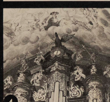
4 LA RENAISSANCE DE LA MUSIQUE D'ORGUES. EN PP. 36-39, B. POCEJ PRESENTE LA TRADITION ET LA CONTEMPORANÉITÉ DES ORGUES POLONAISES