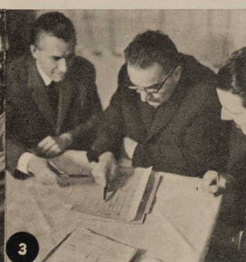
DE NOUVEAUX APPAREILS CARDIO-CHIRURGICAUX : RÉSULTAT DE LA COLLABORATION D'UN TECHNOLOGUE D'UNE USINE DE MOTEURS DE NAVIRES ET D'UN CARDIOLOGUE. PP. 10-11