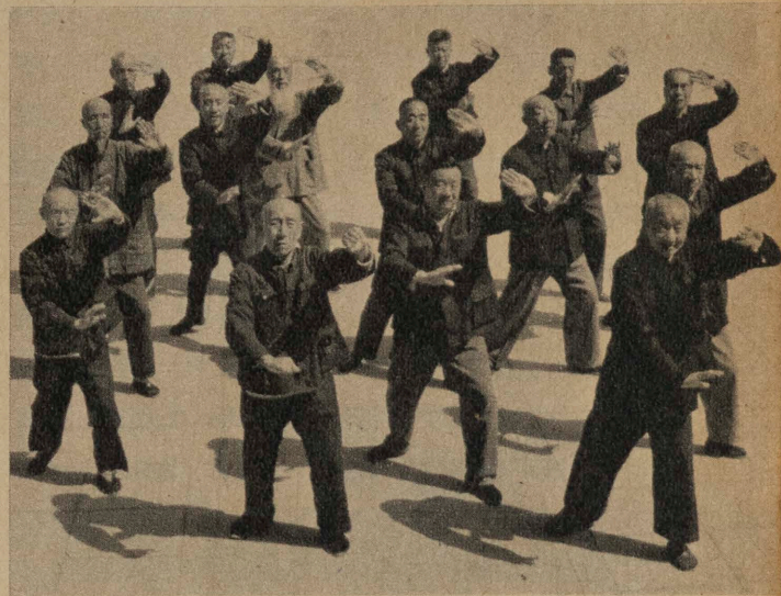
Révélations d'un pasteur retour de Chine : au pays de Confucius une nouvelle foi est née ; celle de Mao, le dieu-vivant. (p. 4).

En posant la question les historiens remettent en cause « la légende » de Montgomery et révèlent les surprenants dessous de la bataille. (p. 70)