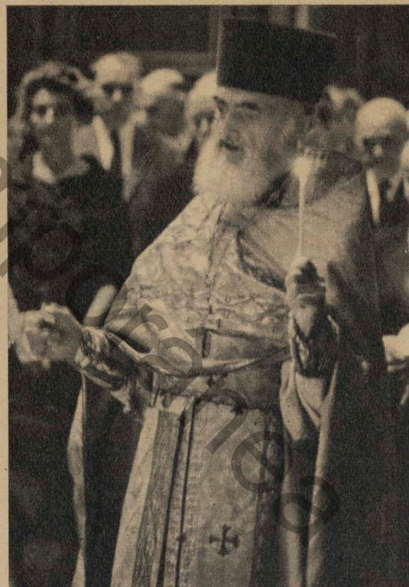
Rapprochement avec la Russie ? Pourquoi pas ! N'oublions pas que trente mille Russes vivent en France depuis un demi-siècle. (p. 58).