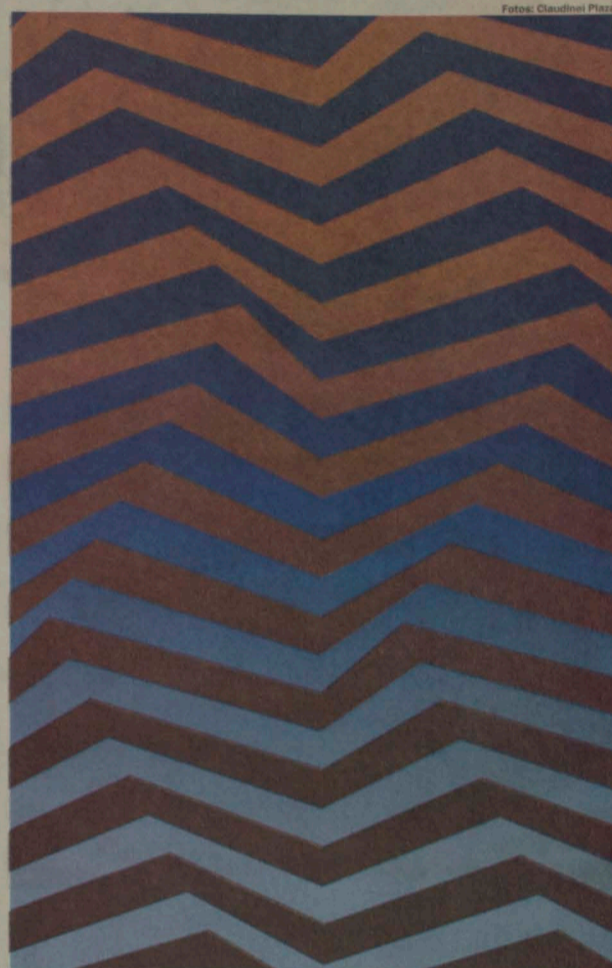
Dois entre as cerca de 90 obras de Sacilotto que serão expostas na Sabina Escola Parque do Conhecimento, em Santo André: efeitos cinéticos, rigor e um notável equilíbrio entre forma e cor