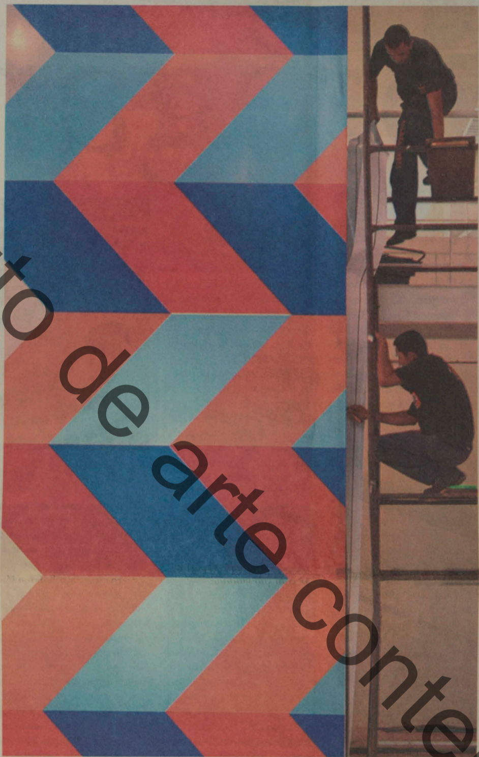
Funcionários finalizam réplica do painel do artista instalado no Sesc andreense, o mesmo reproduzido na casa

Só abre, no entanto, depois do Carnaval, para escolas que agendarem visitas. O público