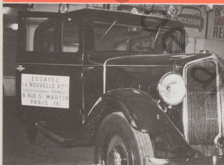
Pour mettre en valeur vos nouveaux modèles

“SIGNAL” Production LA SUPERPLAQUE “Levallois”