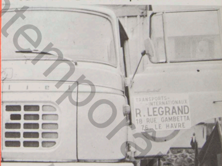
Pour les grosses flottes routières