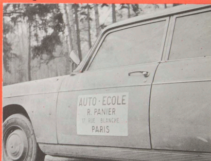
Pour l'Auto Ecole une publicité mobile