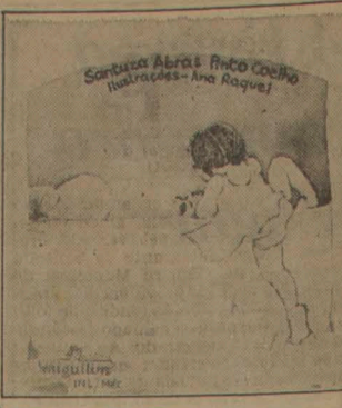
Augusto Roa Bastos