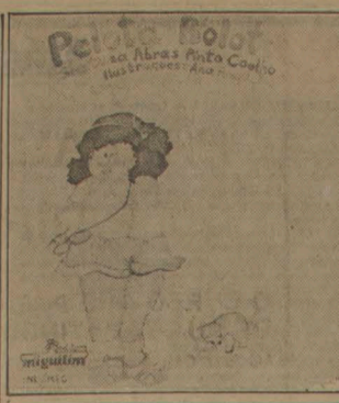
Augusto Roa Bastos