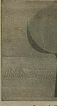
Desenho de Aldo Marchetti