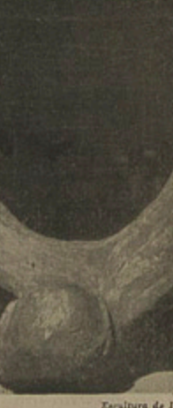
Escultura de Bruno Giorgi