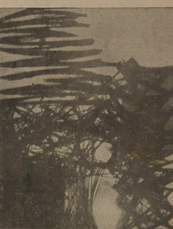
Tela de Franz Kracjberg, prêmio nacional de pintura