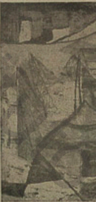
Gravura de Zelinda Mohályi