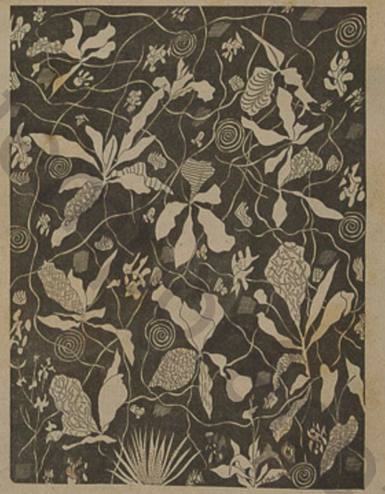
Desenho de Arnaldo Pedroso d'Alta