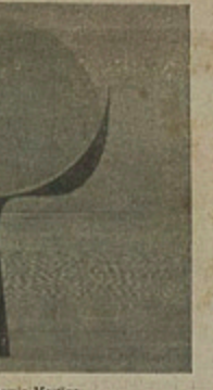
Um trabalho de Faysa Oustrower exposto na Biental