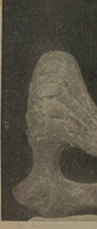
Escultura de Bruno Giorgi

valhos não compareceram. Nem mesmo os gráficos e filigranas: Goeldi, Lívio Abramó, Grassmann, etc.