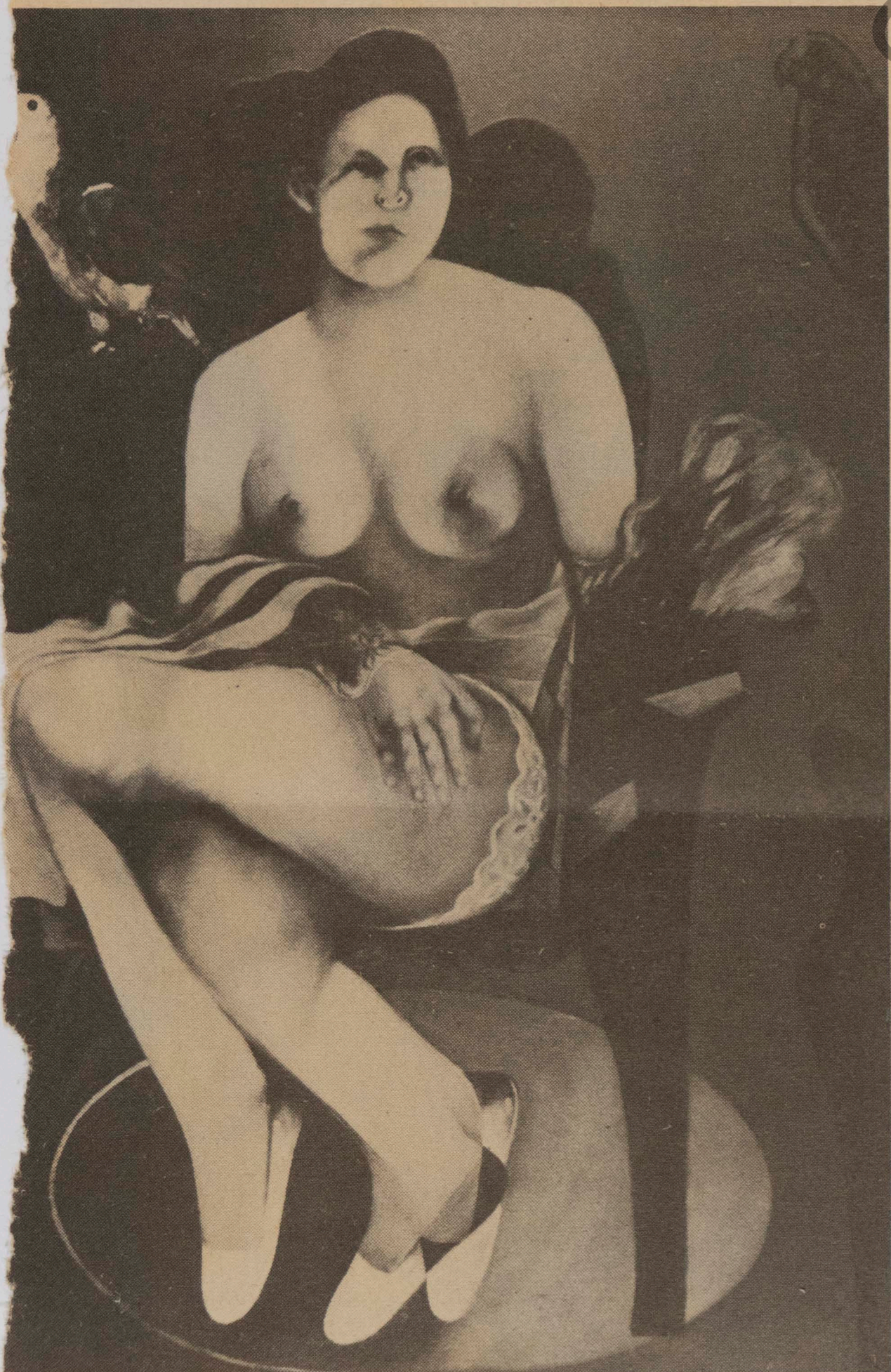
O artista pernambucano J. Moura expõe na Galeria Concorde

A década de 50, em que começou a cair por terra a hegemonia do modernismo nacionalista representado por Portinari, viu aparecerem as duas tendências abstratas, a geométrica e a informal, diferenciadas pelo privilégio dado, ora à abordagem objetiva e racional da arte — cujos principais representantes foram os concretistas de