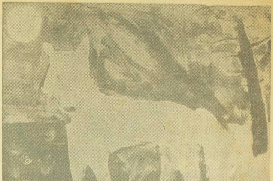
Outro trabalho apreciado pelas professoras na Semana da Arte foi este, feito por estudante de 12 anos, de Curitiba.