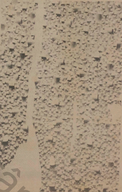
RELIEF N° 13/13 Sergio Camargo

eco, sin espejo, ya que el papel de un crítico es de reflejar, de repetir, con luzidez y con pasión