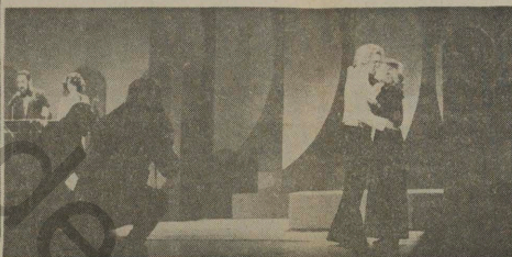
Encontro total à hora da entrega do prêmio da Vivinha, a querida Eva Wilma, para o incrementadíssimo Walmor Chagas. Foi aquele branco. Bárbaro.