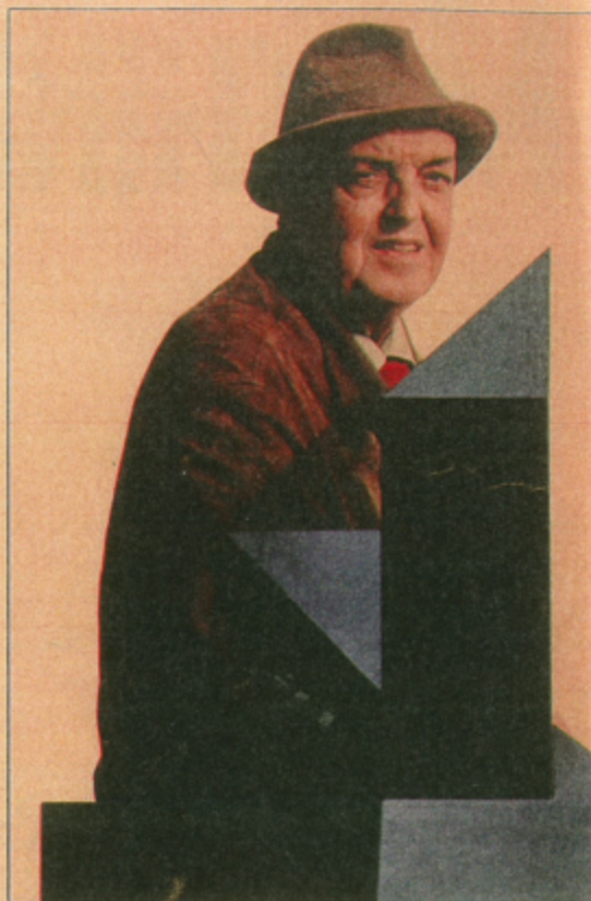
Camargo: poesias francesas e espanholas como fonte de inspiração nas horas vagas

A maratona que Camargo tem cumprido nas últimas semanas, com as duas exposições e o lançamento do livro, lhe