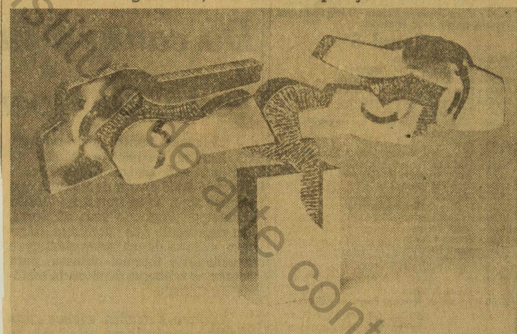
Pássaros e plantas, esculturas de Vlavianos