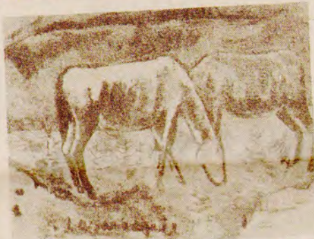
Lasar Segall — "Cavalos em Campos do Jordão".