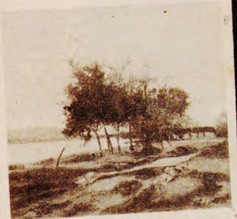
Volpi — "Paisagem com lago".