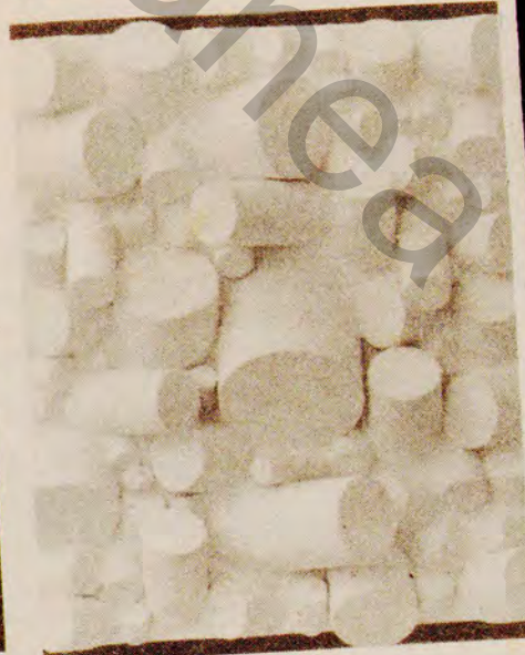
Obra de Sergio de Camargo