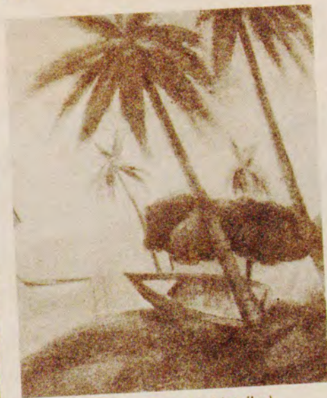
Pancetti — "Mar Grande" (detalhe)