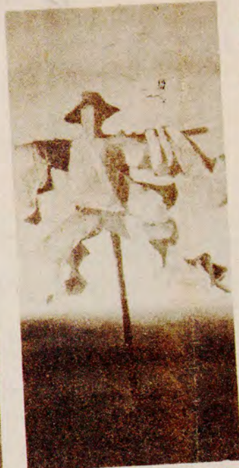
Portinari — "O Espantalho" (detalhe).