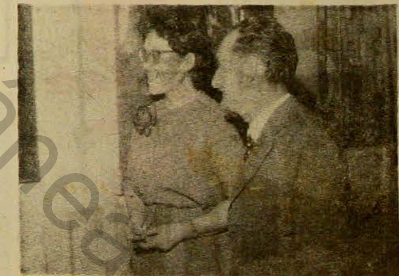
Tomie Ohtake e Aldo Bonadei.