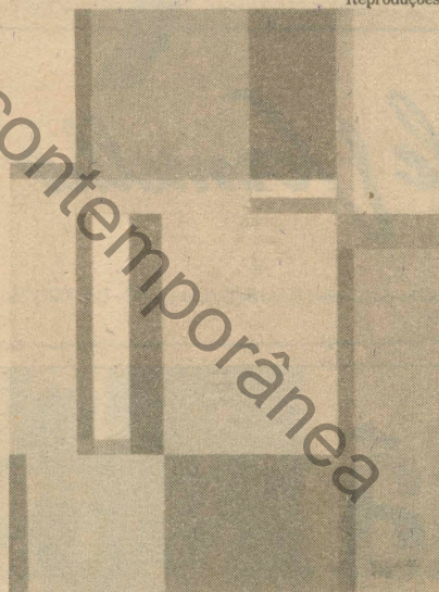
“Pintura I” (1950), 68X50 cm