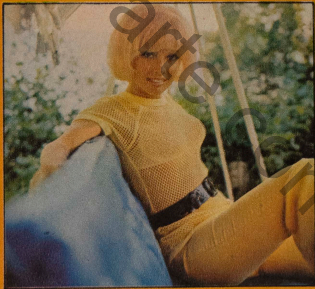
A última virgem escandinava