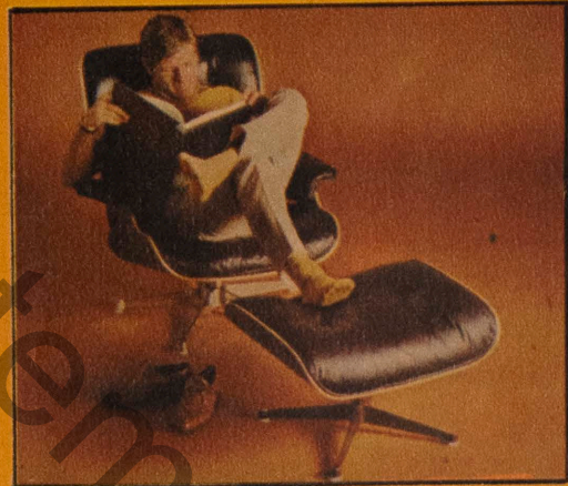
Receita para um intelectual de sucesso