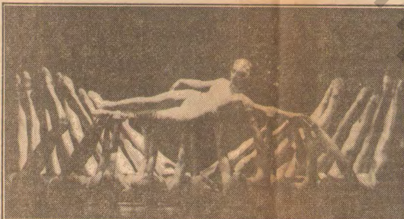
Sonho de uma Noite de Verão: raríssima qualidade.