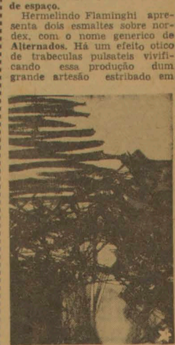
Frans Krajerberg. Tela premiada com o Primeiro Prêmio de Pintura Nacional do IV Bienal de São Paulo.