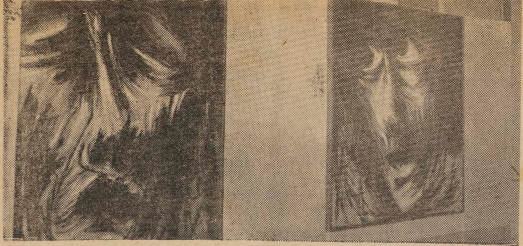
Ivan Serpa foi um dos introdutores do concretismo, no Brasil. Hoje, as suas cabeças de homem se apresentam diante do mundo como figuras trágicas. Procuram retratar a totalidade do indivíduo diante da vida

Conseguiu praticamente todos os prêmios importantes do país, desde a Medalha de Bronze, no Salão Nacional de Belas Artes, em 1948, até os prêmios de valgem ao país e ao estrangeiro do Salão Nacional de Arte Moderna. Foi premiado quatro vezes nos Bienais de São Paulo. É professor de pintura do Museu de Arte Moderna do Rio de Janeiro.