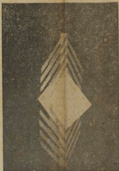
Concretion, Sacilotto, 1960, alumínio.