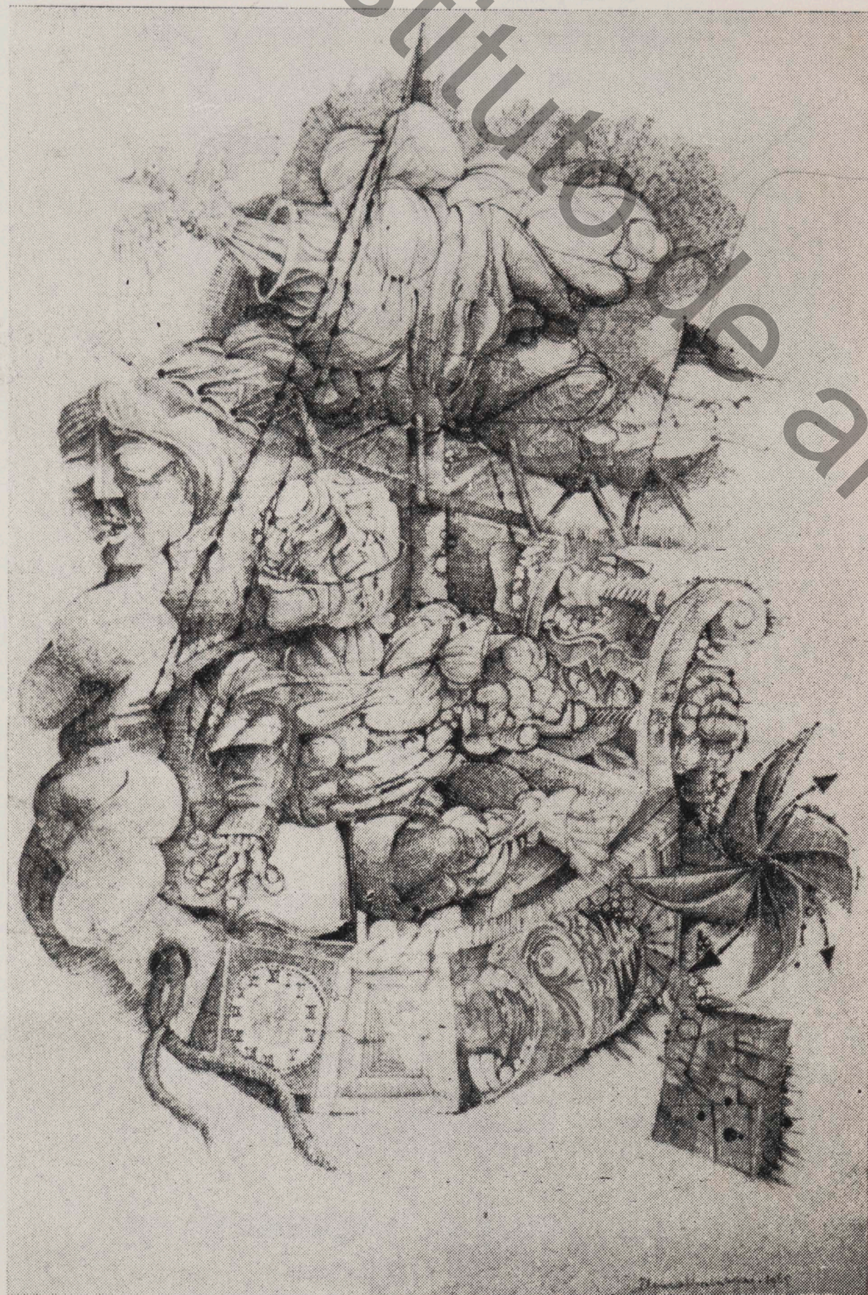
1.º Prêmio de Desenho