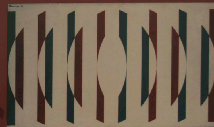
Hermelindo Fiaminghi Círculos com movimento alternado , 1956 esmalte s/ nordex, 35 x 60 cm Fundo para aquisição de obras para o acervo do mamp - Banco Bradesco S.A.