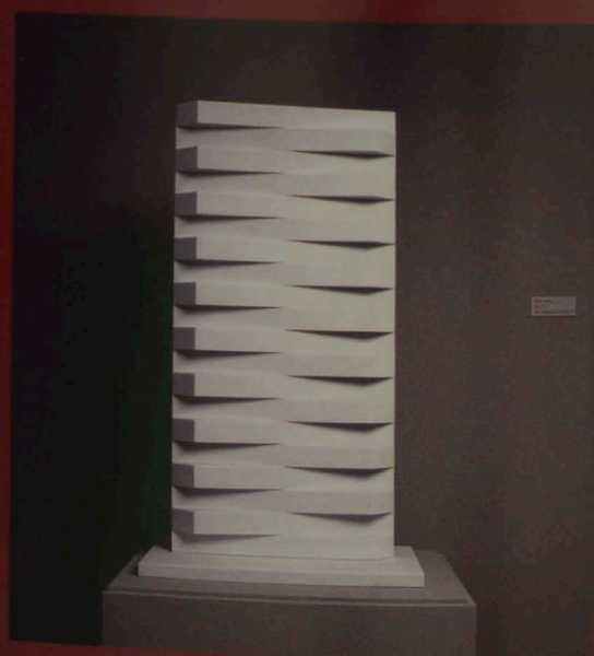
Sérgio Camargo # 502 , 1978 mármore, 104 x 60 x 30 cm Fundo para aquisição de obras para o acervo do mamp - Banco de Crédito de SP S.A./G. Zogbi