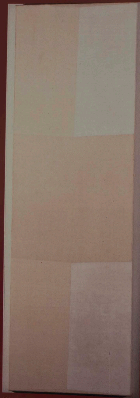
Hércules Barsotti Três brancos , 1959 óleo sobre tela, 119,6 x 40 cm Fundo para aquisição de obras para o acervo do mamp - Banco Bradesco S.A.