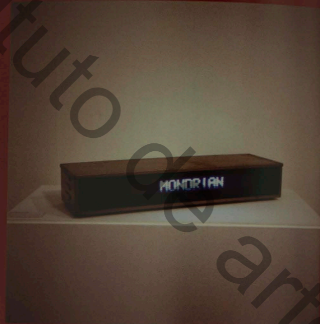
Waltércio Caldas A Experiência Mondrian , 1978 objeto, 13,3 x 72,3 x 22,3 cm Fundo para aquisição de obras para o acervo do mamp - Cia Vale do Rio Doce