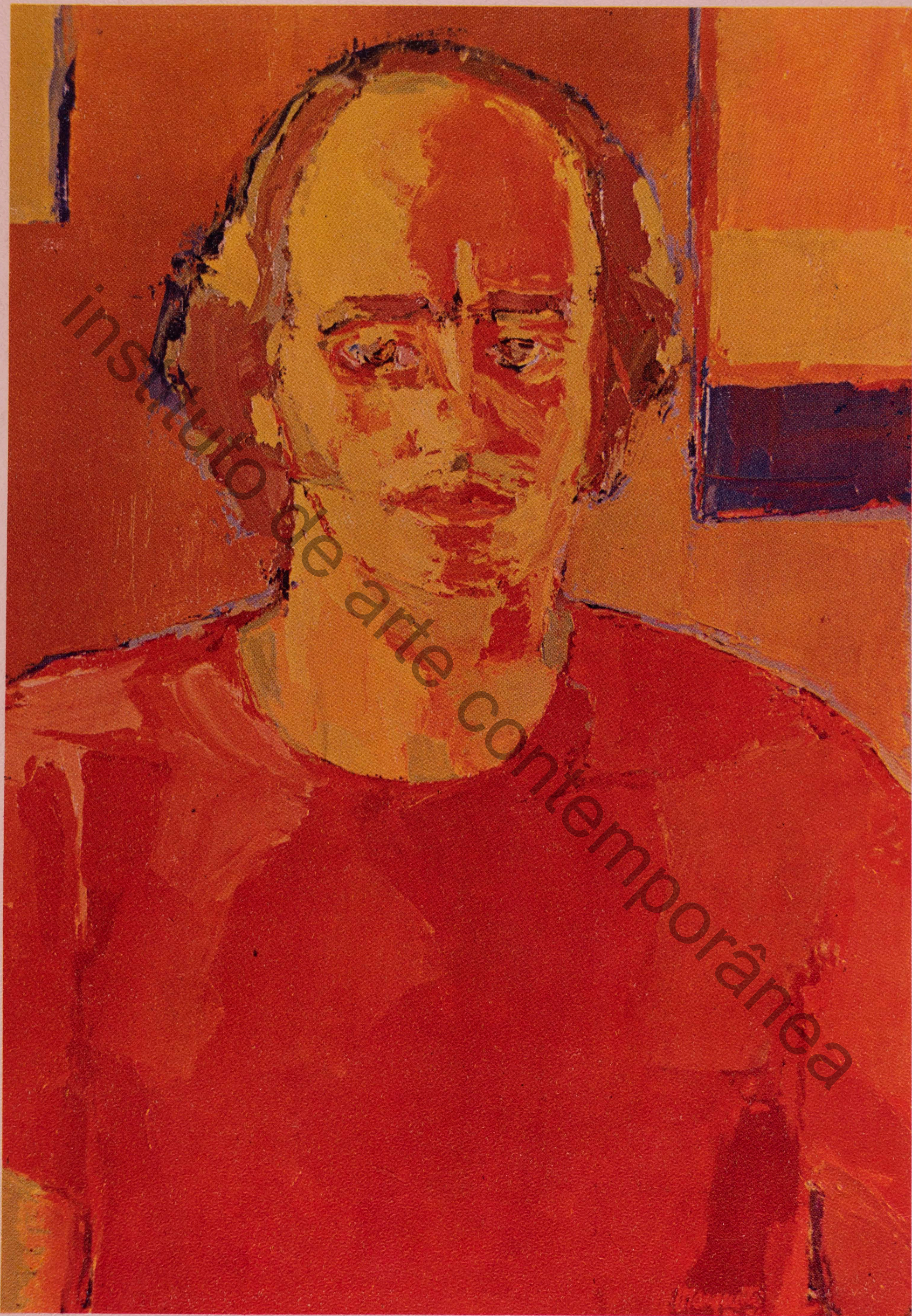
Marquetti • Olinda • 73-74 • óleo