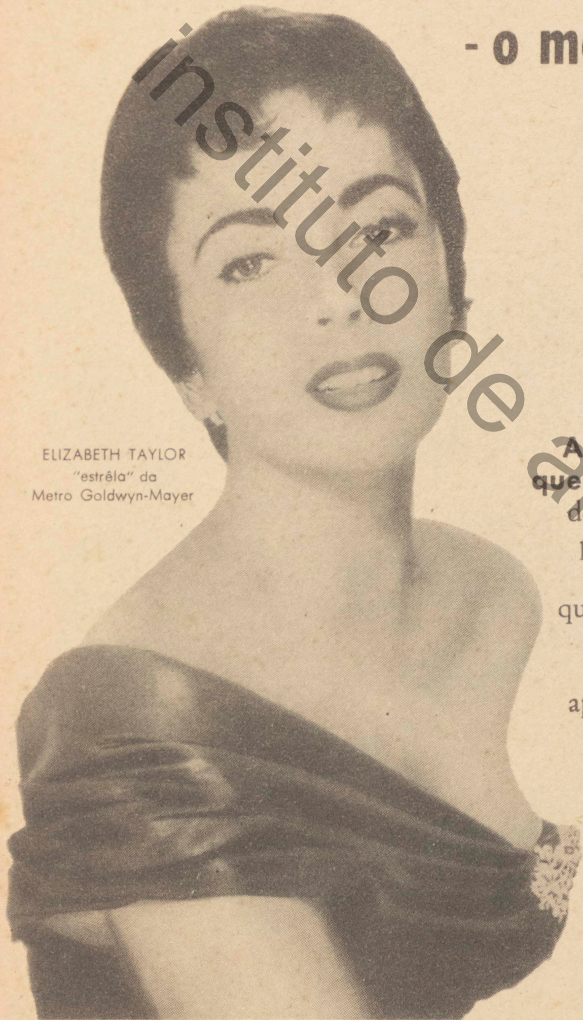
ELIZABETH TAYLOR "estrela" da Metro Goldwyn-Mayer

Para assegurar sua posição privilegiada junto a 9 entre 10 "estrelas" do cinema e milhões de fãs em todos os países, Lever precisa manter-se como o melhor sabonete do mundo. Por isso, os Laboratórios Lever estão sempre pesquisando novos recursos para enriquecer cada vez mais a fórmula do "Sabonete das Estrelas" e, conseqüentemente, torná-lo ainda melhor.