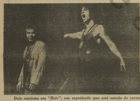
Dois sanistas em "Hair", um espetáculo que está saindo de cartaz

Para as apresentações em Santos, a poltrona custa Cr$ 15,00; os camarotes de primeira a terceira fileira, Cr$ 10,00 e Cr$ 7,00, respectivamente; balcão, Cr$ 10,00; e galerias, Cr$ 5,00. Estudantes universitários têm desconto e podem adquirir seus ingressos no Centro Acadêmico "Jackson de Figueiredo", da Faculdade de Comunicação.