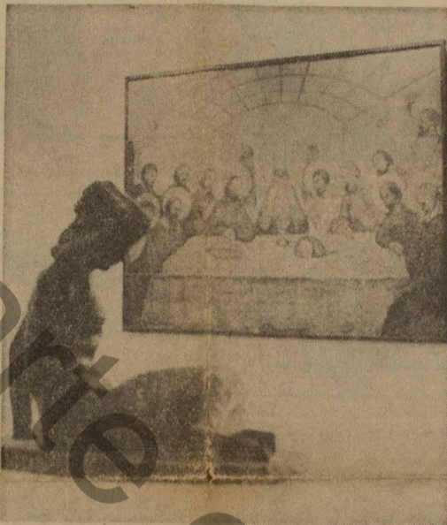
O afresco de Gomide, agora integrado ao acervo do MAC