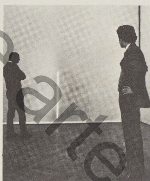
Maurizio Mochetti : “Linéa luce”