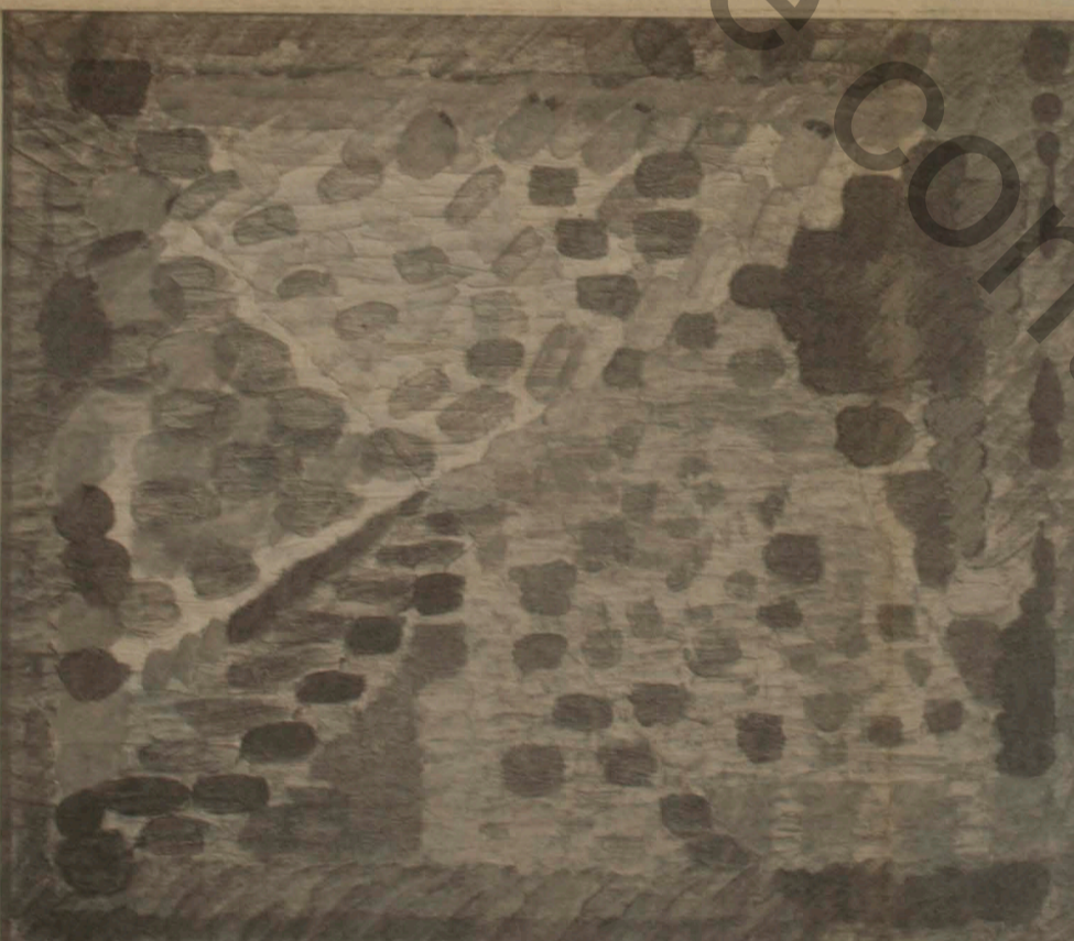
Pintura de Hermelindo Fiaminghi ("Corlus 6087"), em exposição na galeria Montesanti até o fim do mês

das 10h às 18h. Sábado e domingo, das 15h às 20h. Até dia 31. Vernissage às 18h.