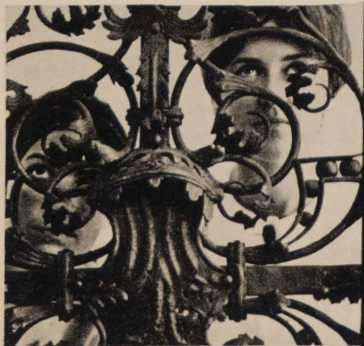
LA ARTESANÍA ARTÍSTICA DE BAJA SILESIA, DESDE EL MEDIEVOO HASTA EL SIGLO XIX. FOTOGRAFÍAS Y TEXTO EN LAS PÁGS. 8-9