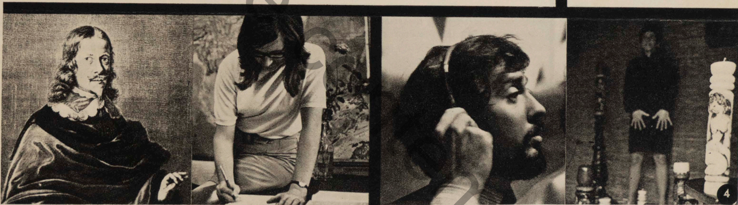
JUAN HEVELIUS, DE GDANSK, ASTRÓNOMO DEL REY JUAN III Y CONTINUADOR DE COPÉRNICO. PÁGS. 31-32