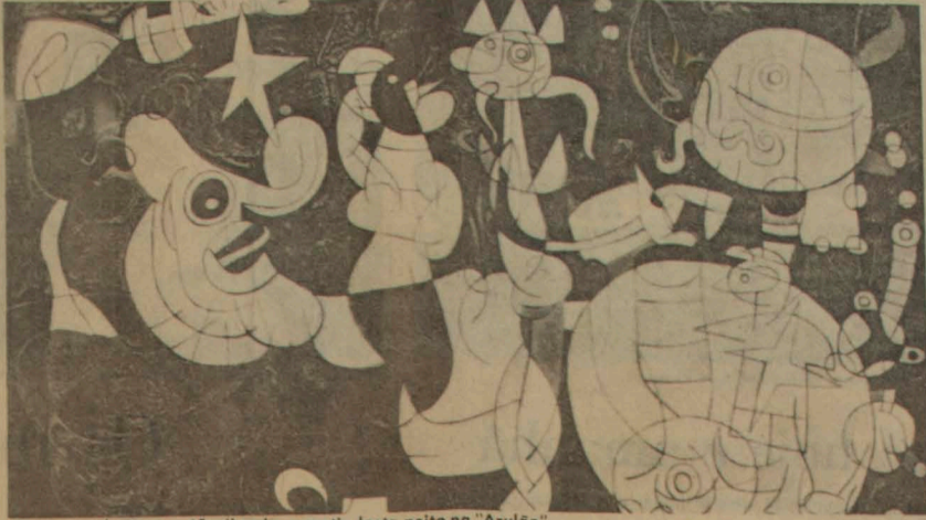
A gravura de Miró, a 45 mil cada, a partir desta noite no "Azulão".