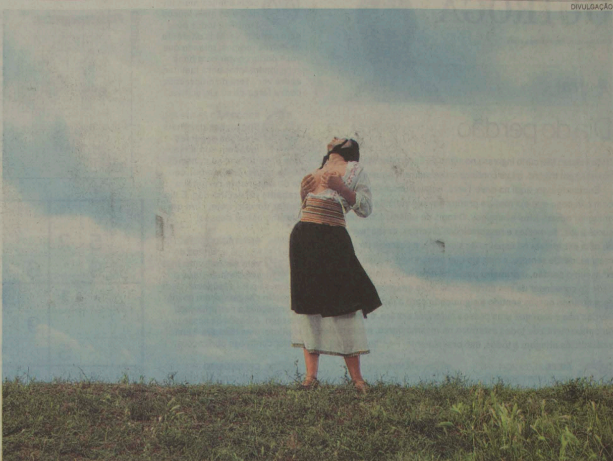
RITUAIS ANTIGOS - Marina Abramovic e série de vídeos sobre o povo dos Balcãs: guerras fratricidas, erotismo e espiritualidade telúrica

Já o Masp inaugura amanhã a primeira exposição organizada por seu novo curador, Teixeira Coelho: A Arte como Crítica de Arte , que vai reunir 90 obras de arte moderna e contemporânea brasileira. ●