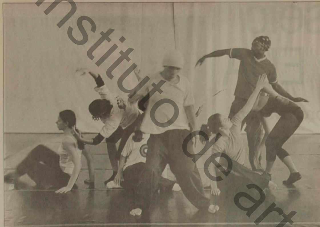
Grupo durante ensaio: duas apresentações devem acontecer próximas a esculturas de Sacilotto