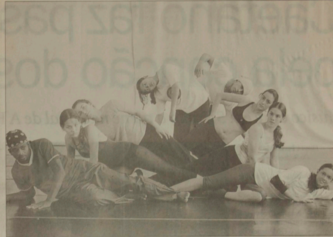
Os bailarinos fizeram pesquisa na área de artes plásticas para criar a coreografia em conjunto