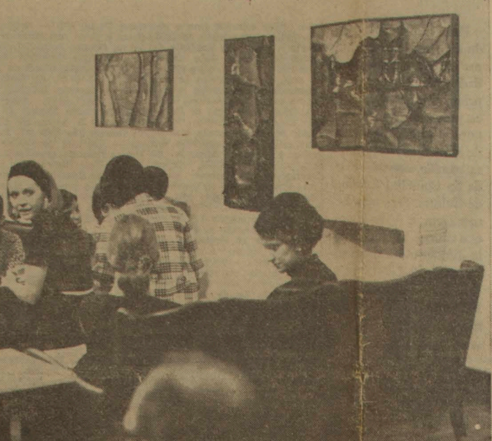
O Mutirão está expondo desde ontem trabalhos de Theo P. de Souza