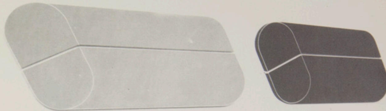
DA SINISTRA "ASSONOMETRIA ROSSA" 1969 / OLIO SU TELA / CM. 220 x 95 x 7 "ASSONOMETRIA NERA" 1969 / OLIO SU TELA / CM. 200 x 95 x 7