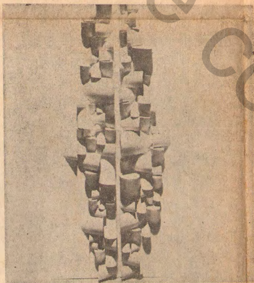
Sérgio Camargo, prêmio de escultura