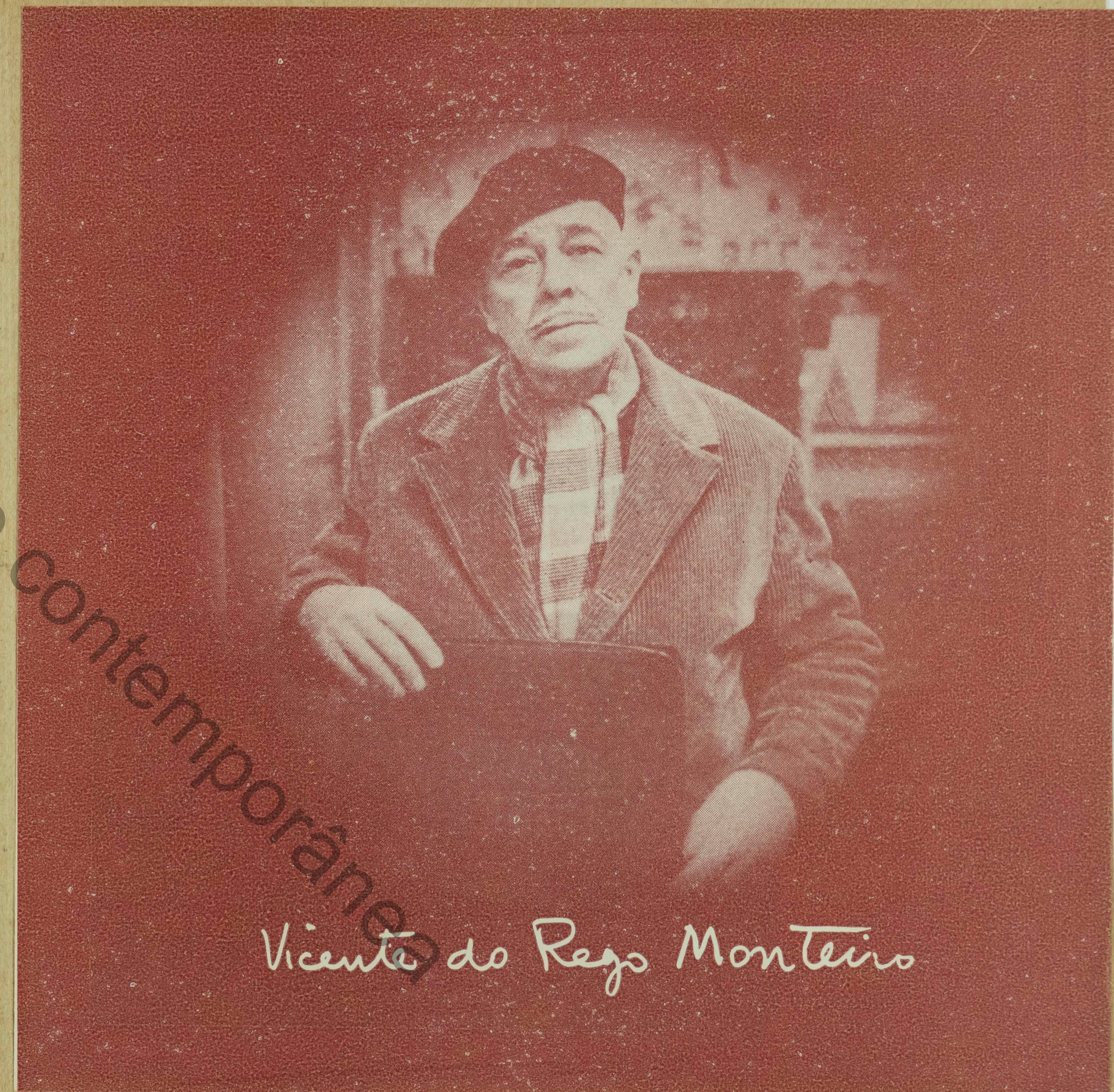
Vicente do Rego Monteiro