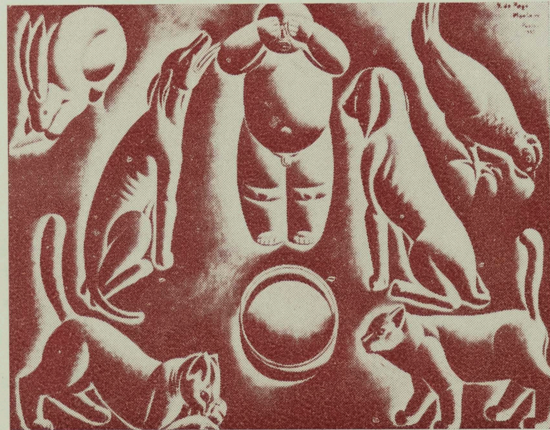
"O Menino e os Bichos" Musée du Jeu de Paume Paris 1925