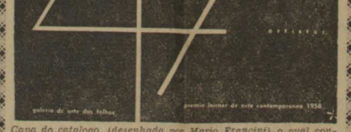
Capa do catálogo, ideada por Mauro Francini, com informações sobre a galeria, premios e artistas concorrentes, bem como fotografias de obras expostas e dos participantes do certame que será inaugurado amanhã.