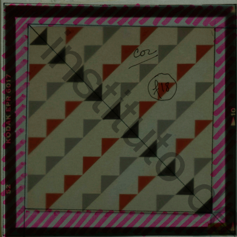
61. "Triângulos com movimento em diagonal", 1956 Esmalte s/eucatex, Formato: 60x60cm Coleção Ronaldo Azeredo