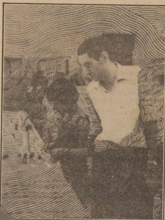
Auto-Retrato de Ivan Serpa