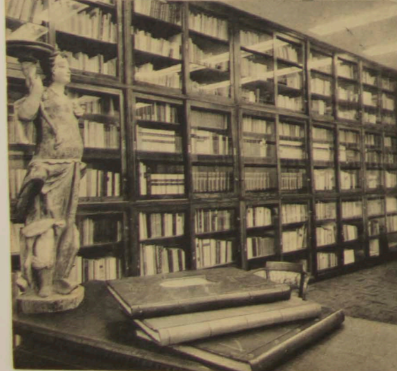
Biblioteca especializada contendo livros e revistas sobre propaganda de todo o mundo, com resumos em português.