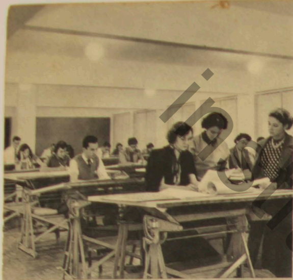
Aulas de Layout e arte-final de anúncios, em salas de desenho adequadas.