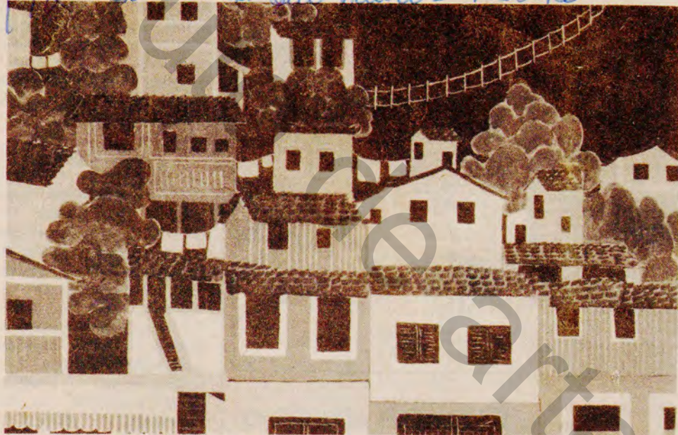
Um dos 15 quadros de Melinda, na Mini Galeria do USIS