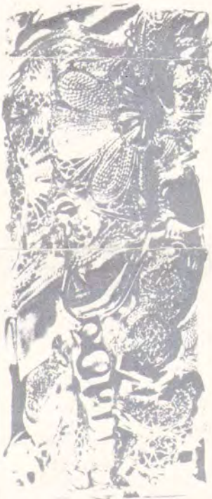
Compression de CESAR en or (bijoux) - Haut. 5 cm. Vente du dimanche 5 mars à 21 h.

Exposition le samedi 4 mars de 21 h à 23 h et dimanche 5 mars de 10 h à 12 h et de 14 h à 18 h.