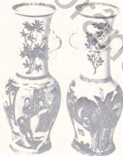
Paire de grands vases ép. K'ang- hi (expert : M. Beurdeley). Ven- te du mardi 7 mars à 14 h 30.

MM. L.-H. PROST - B. et J.-P. DILLÉE - O. LE FUEL - Ch. RATTON M. BEURDELEY