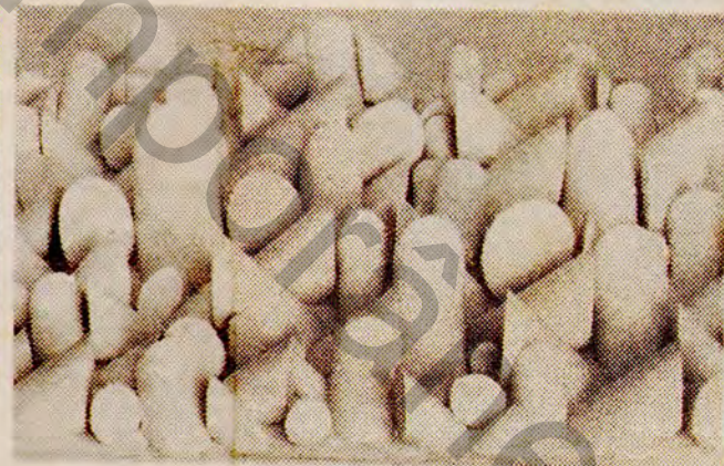
Relevo de Camargo

1 — Aquarelas e gravuras belgas contemporâneas é o título da exposição que o Museu de Arte Moderna do Rio de Janeiro inaugura hoje, às 18h30m, na presença do Ministro do Comércio Exterior da Bélgica, Henri Fayat. A mostra terá a duração de apenas uma semana — até 30 de setembro —, e se compõe de originais de 30 artistas das gerações mais novas. A apresentação, no catálogo, é do crítico Marcel Duchateau.